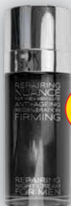
Nuance For Men Absolute Reparativní noční krém pro muže 50 ml