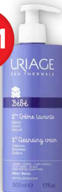
Uriage Bébé Mycí krém pro nejmenší 500 ml