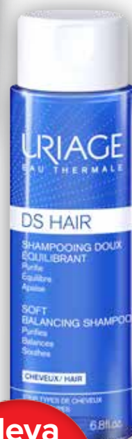
URIAGE DS HAIR Jemný zklidňující šampon 200 ml