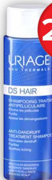
URIAGE DS HAIR Šampon proti lupům 200 ml