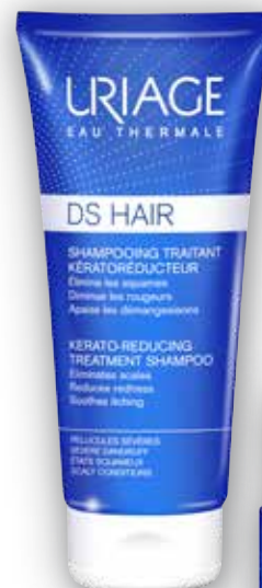
URIAGE DS HAIR Šampon na pokožku trpící nadměrnou tvorbou lupů 150 ml

Při nákupu tří kosmetických přípravků značky Uriage řady Bébé získá držitel Karty výhod Dr.Max nejlevnější z nich navíc za 0,01 Kč.