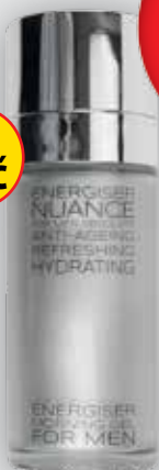
Nuance For Men Absolute Osvěžující ranní gel pro muže 50 ml