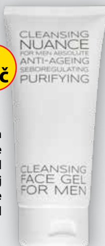
Nuance For Men Absolute Čistící gel na obličej pro muže 100 ml