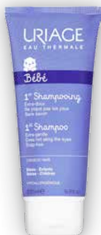
Uriage Bébé Šampon pro nejmenší 200 ml