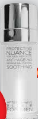
Nuance For Men Absolute Balzám po holení pro muže 50 ml