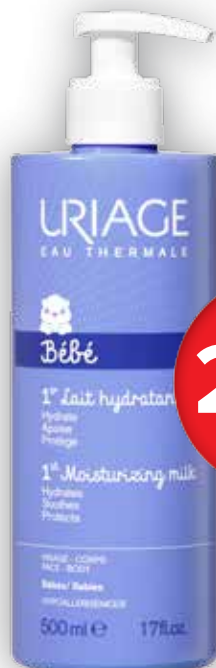
Uriage Bébé Hydratační tělové mléko pro nejmenší 500 ml